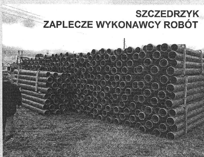
SZCZEDRZYK ZAPLECZE WYKONAWCY ROBÓT