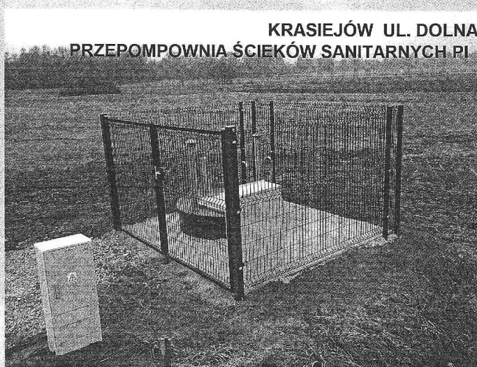
KRASIEJÓW UL. DOLNA PRZEPOMPOWIA ŚCIEKÓW SANITARNYCH PI