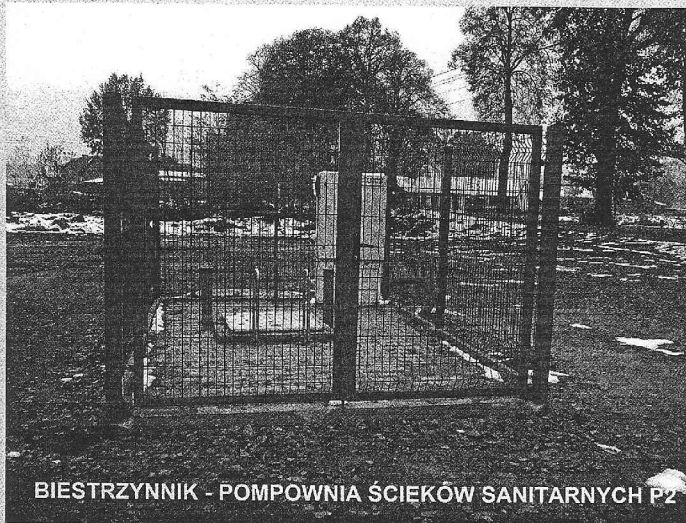
BIESTRZYNNIK - POMPOWIA ŚCIEKÓW SANITARNYCH P2