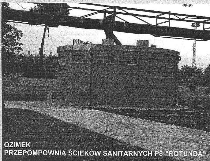
OZIMEK PRZEPOMPOWIA ŚCIEKÓW SANITARNYCH P8 "ROTUNDA"